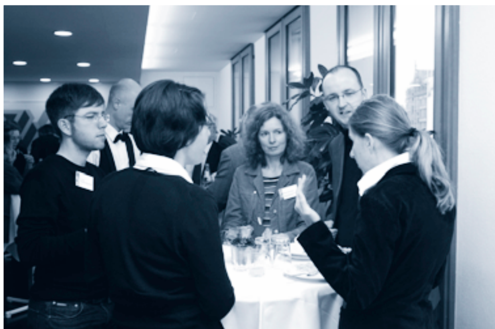
Vertiefende Gespräche am Rande des stark frequentierten Kongresses