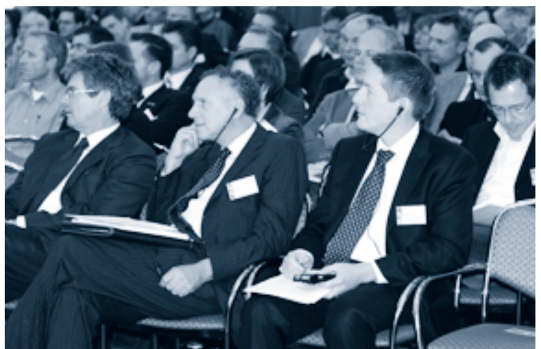
... und beteiligte sich rege an der Diskussion