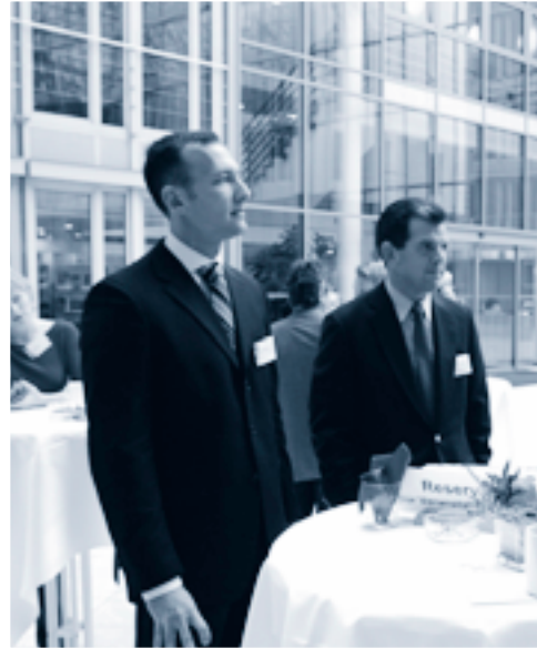
Geschäftiges Treiben am Info-Counter und gespanntes Warten im Foyer