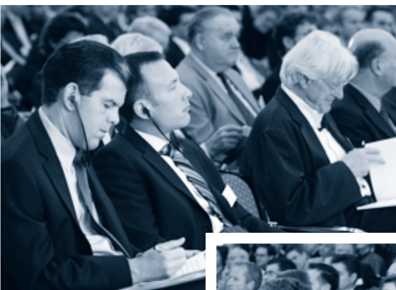
Das Publikum lauschte konzentriert ...