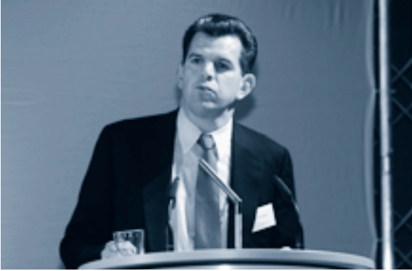
Robert Walsh Small Business Services, New York

Nach wie vor herrsche der verbreitete Irrglaube, in New York ginge es nur ums Big